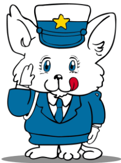
新潟県交通安全マスコット ルルちゃん

9月30日(水)は『交通事故死ゼロを目指す日』です 全国では記録の残る昭和43年以降、毎日、交通死亡事故が発生している状況です。このような中、平成20年1月に交通安全に対する国民の意識を高めるため、新たな国民運動として「交通事故死ゼロを目指す日」を設けることとされました。