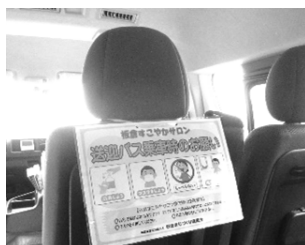
▲バス乗車時のお願い

また、宮古島市城辺地区との交流についてもコロナ感染症の影響により中止としました。