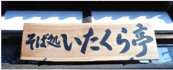
▲リニューアルされた看板

日頃より皆様にご愛顧いただいております「そば処いたくら亭」も、振興会に運営が移管されてはや9ヶ月が経ちました。