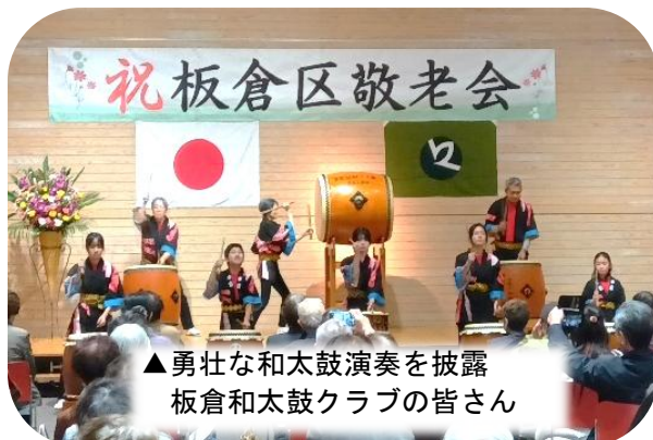
▲勇壮な和太鼓演奏を披露 板倉和太鼓クラブの皆さん