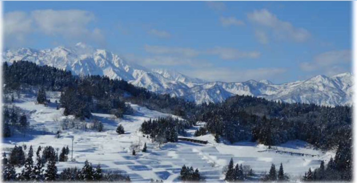
▲くびき野パノラマ街道より望む棚田の風景